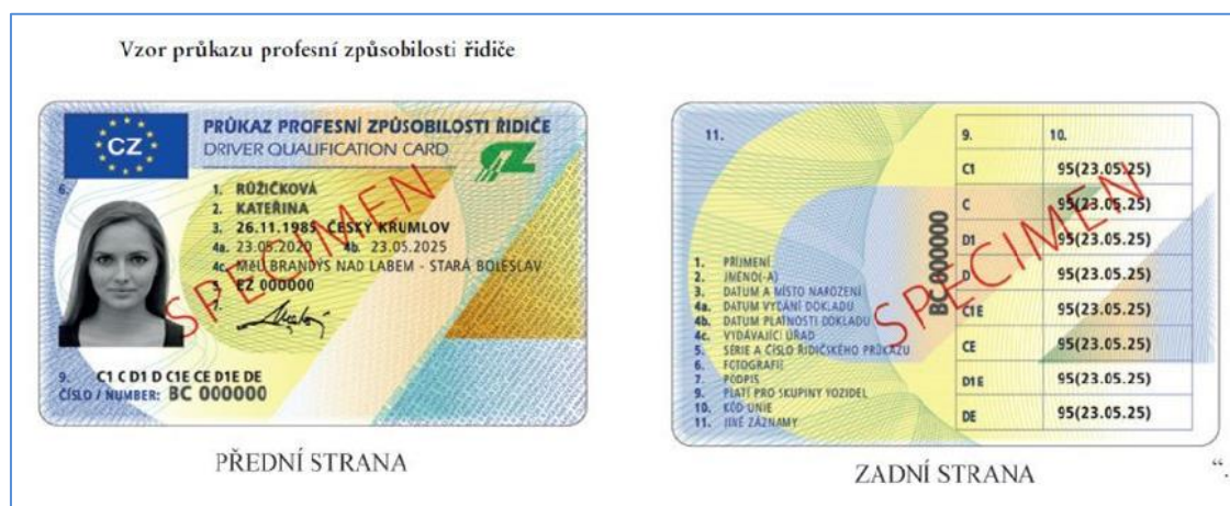
Obrázek 3 - Průkaz profesní způsobilosti řidiče