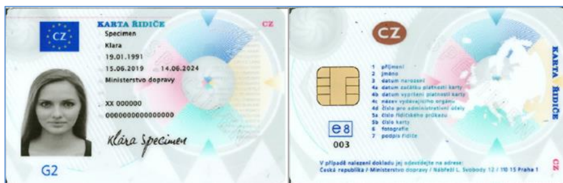
Obrázek 1 - Karta řidiče